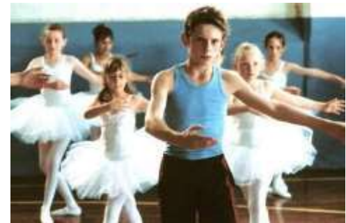
Billy Elliot, Stephen Daldry