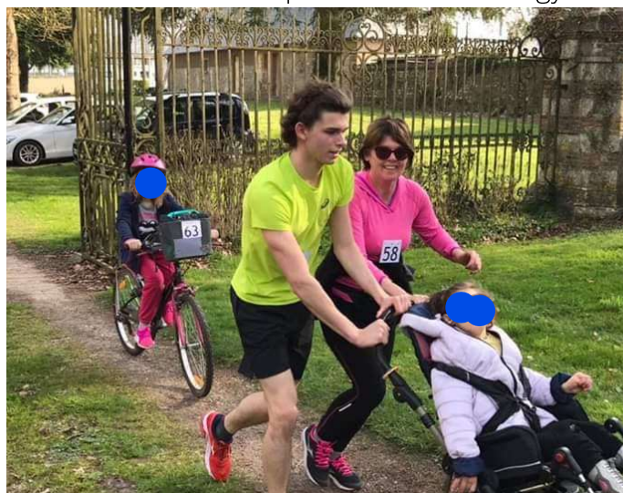
Duo de la Buissonnière avec son frère et sa mère